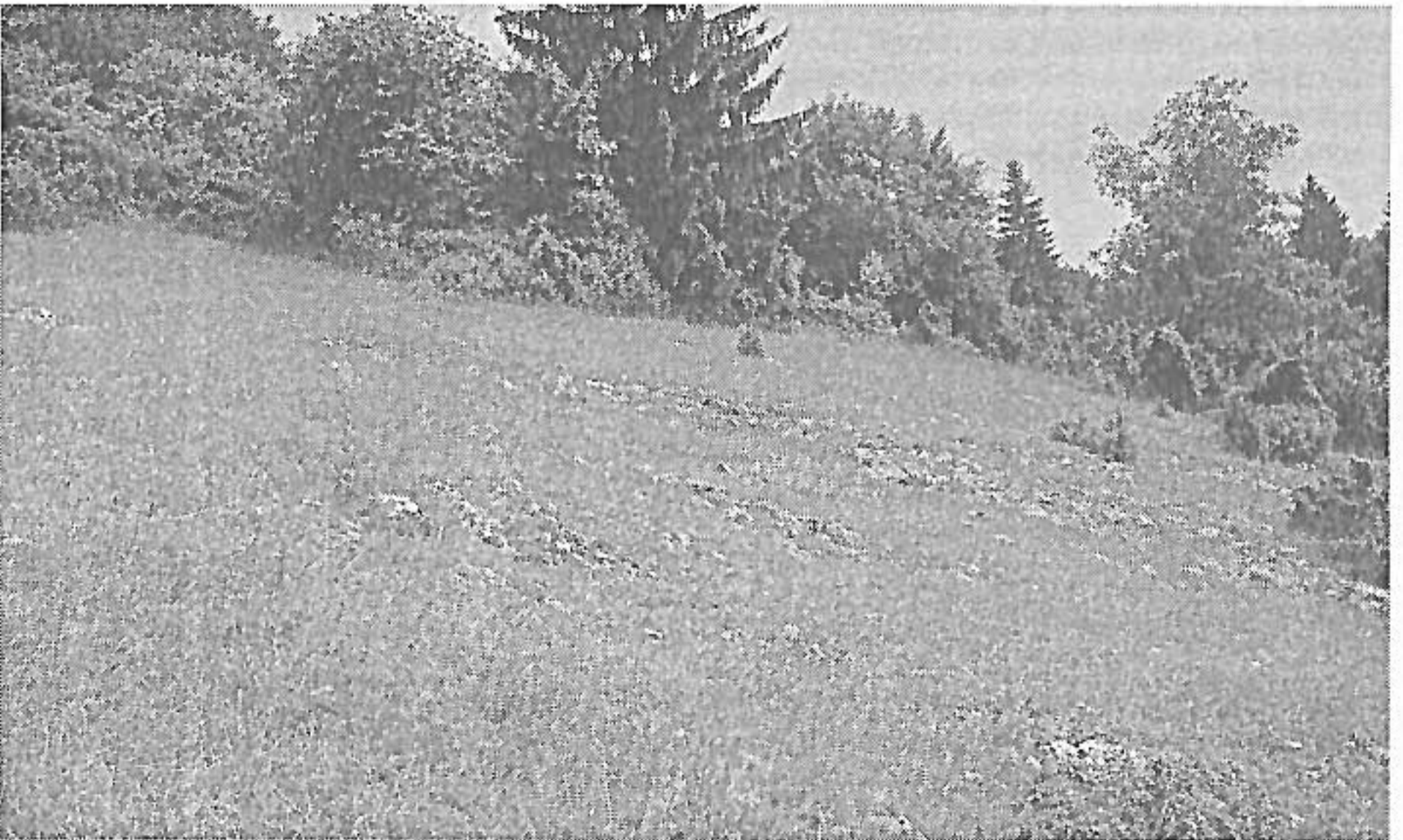
Abb. 2: Lebensraum von E. lutarella und E. pygmaeola bei Heidenheim. Die xerothermen, beweideten und felsig-steinigen Offenflächen im Vordergrund werden mehr von E. pygmaeola besiedelt, die verbuschenden Bereiche im Hintergrund, die aber noch kleinere und größere offene Bereiche zwischen den Gehölzen aufweisen, dagegen von E. lutarella . Heidenheim, 21.6.2000 (Raupenzeit).